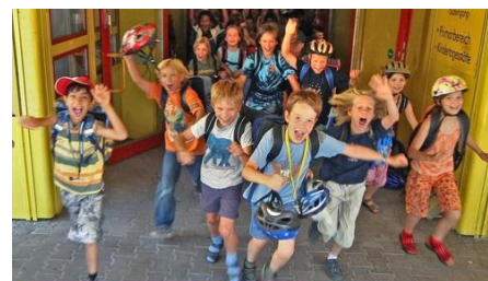
Klassenausflug in den Kletterpark Schöckl

Ihr Kind sollte festes Schuhwerk, keine extrem kurzen Hosen und dem Wetter angepasste Kleidung tragen.